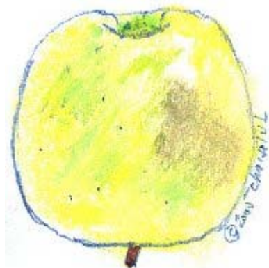
Pastel Jean-Louis Choisel © 2005 selon Mas 1882/83.